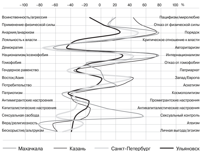
Рис. 3. Ценностные векторы компаний молодежи четырех городов

ков (школьников и студентов) в протестных демонстрациях против коррупции во всех крупных городах России. Последующие реакции политиков, официальной журналистики и части представителей учительского корпуса свидетельствовали о неготовности прямого открытого диалога с участниками демонстраций.