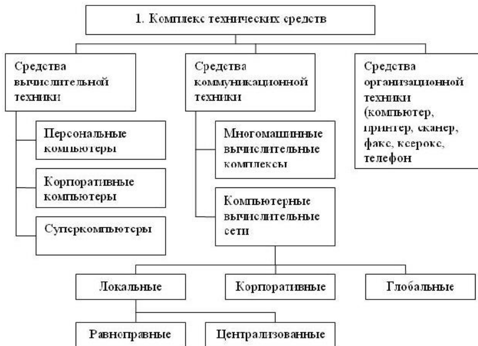
Рисунок 1 - Структура комплекса технических средств АИТ

Таблицы применяют для лучшей наглядности и удобства сравнения показателей и оформляют в соответствии со следующими требованиями: название таблицы должно отражать ее содержание, быть точным, кратким и помещаться над таблицей; таблицы, за исключением таблиц приложений, следует нумеровать арабскими цифрами сквозной нумерацией.